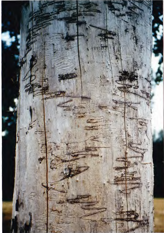
Abb. 2: Pappelstamm mit Fraßbild von Agrilus ater (L.) in Kerpen-Brüggen 1993.

alte Nachweise aus Koblenz und Bonn-Beuel (ROETTGEN 1911), sowie Düsseldorf-Oberkassel, wo ERMISCH im Juni 1935 ein Exemplar an einer abgestorbenen, rindenlosen Schwarzpappel am Rheinufer fand (ERMISCH in HORION 1936). NIEHUIS (1988) hält die Art für gefährdet, da ihre Vorkommen auf seltene, durch Bebauung und Auskiesungen bedrohte Auwaldgebiete beschränkt seien. Eine solche Gefährdung dürfte in der Niederrheinischen Bucht nicht bestehen, da zumindest die Hybridpappeln hier zu den häufigsten Baumarten zählen. Vorkommen und Häufigkeit von Agrilus ater dürften vielmehr von klimatischen Faktoren abhängig sein.